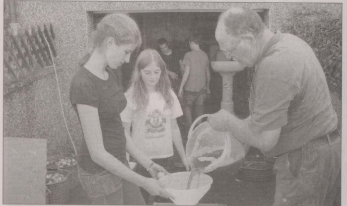
Apfelkelttern zu einem Schulprojekt...

„Die Ernte war in diesem Jahr sehr, sehr gut, kreisweit. Es wird viel Obst hängen bleiben. Das fing schon an bei einer guten Ernte der Johannisbeeren, bei den Himbeeren, Brombeeren, bei Kirschen, die Bäume hingen brechend voll, Mirabellenbäume sind teils zusammengekracht. Ich möchte sage, wir haben 20-25 % dort oben mehr, dieses Jahr.“